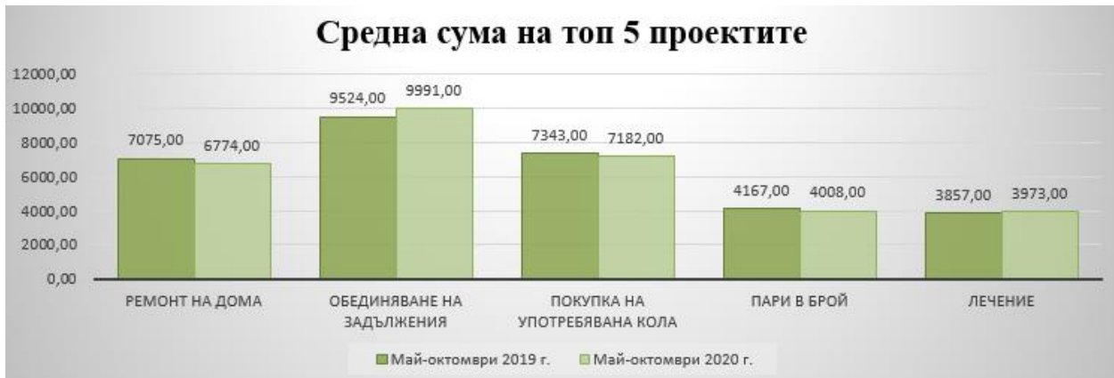
Таблица 2: Средна сума на молбите за топ 5 проектите

Средната сума на заявленията за потребителски кредити, подадени към БНП Париба Лични Финанси в България през последните шест месеца беше 7 071 лева, което е много близо до година по-рано, когато сумата беше 7 160 лева. Най-висока средна сума беше отчетена през октомври – 7 565 лева, което се обяснява с надеждата за предприемане на стъпки за възстановяване на икономиката и уверенията на властите, че анти-Ковид мерките целят избягване на пълно затваряне.