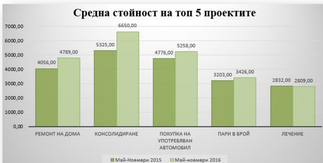
Таблица 2: Средна сума на молбите за топ 5 проектите

Трите топ проекта, за които хората кандидатстваха за финансиране формираха над 75% от молбите за потребителски кредит, получени от БНП Париба Лични Финанси, България в периода май-ноември 2016. Средната сума на запитванията нарасна със 17,9% на годишна база.