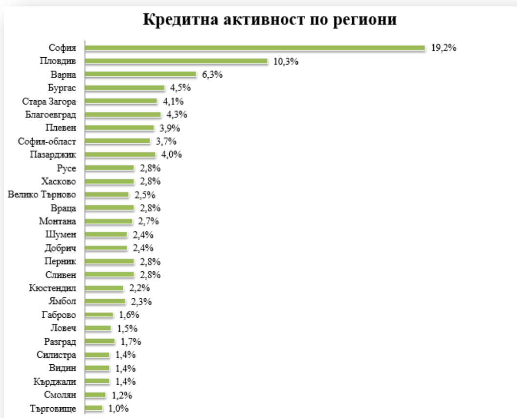
Таблица 3: Кредитна активност по региони

Новото издание на обзора „Потребителският кредит на българина“ показва, че кредитната активност е най-висока в София, с 19,2% от молбите за периода. На второ място е Пловдив с 10,3%, на трето Варна – с 6,3%, а на четвърто Бургас – с 4,5%. Най-слабо активни са регионите Смолян и Търговище с 1% и 1,2% от молбите.