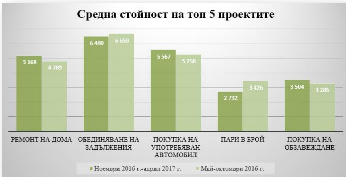
Таблица 2: Средна сума на молбите за топ 5 проектите

В същото време беше отбелязан значителен спад на средния размер на молбите за потребителски кредити за пари в брой и плащане на сметки. В периода май-октомври 2016 г. хората кандидатстваха за кредити за пари в брой със среден размер 3 426 лв. През последните 6 месеца той се понижи до 2 732 лв. или с 20,25%. Размерът на запитванията за кредити за плащане на сметки се понижи със 17,4% от 2 440 лв. през май-октомври 2016 г. до 2 016 лв. през ноември 2016 г.-април 2017 г. През последните 6 месеца умерен спад от 170 лв., в сравнение с май-октомври 2016 г., отбеляза и средният размер на молбите за обединяване на задължения като достигна до 6 480 лв.